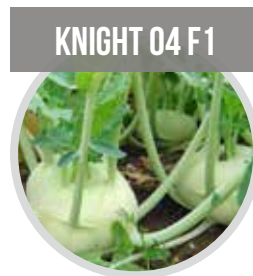
KNIGHT 04 F1